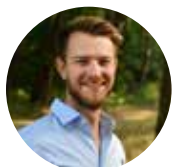
Tom Wolfs Afdelingsvoorzitter

In naam van alle N-VA-bestuursleden wens ik u een prachtig en deugddoend vervolg van de zomer.