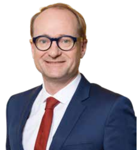
Ben Weyts Vlaams minister

De Asserweg is nog steeds een gewestweg. Sinds het knippen van de verbinding met As heeft het Agentschap Wegen en Verkeer (AWV) nauwelijks nog geïnvesteerd in het onderhoud van deze weg. Het gemeentebestuur van Zutendaal is vragende partij om de Asserweg opnieuw aan te leggen en nadien over te nemen. N-VA-minister van Mobiliteit en Openbare Werken Ben Weyts maakte 800 000 euro vrij in het Vlaamse budget 2020 om de weg opnieuw aan te leggen. Eens aangelegd, zal de weg aan het gemeentebestuur overgedragen worden. We zijn blij dat het gemeentebestuur dit dossier op de rails heeft gekregen. Een tot op de draad versleten verbindingsweg zal zo ingericht worden tot een mooie woonstraat.