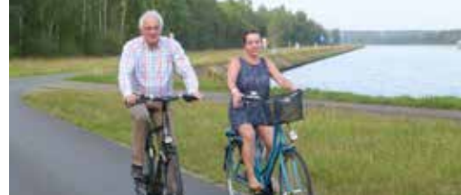
Fietssnelweg in Zutendaal p.3