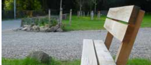
Zutendaal investeert in groen p.2