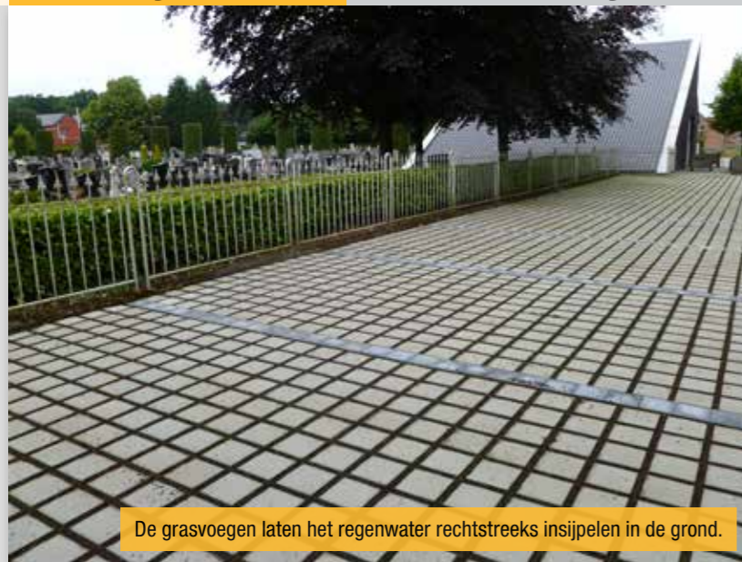
De grasvoegen laten het regenwater rechtstreeks insijpelen in de grond.

Het kerkhof is één van de drukst bezochte locaties in de gemeente. Daarom kozen we ervoor om de parking om te vormen en zo het onderhoud zonder gebruik van pesticiden te vergemakkelijken.